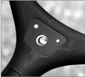
Abb. 7: Display am Griff