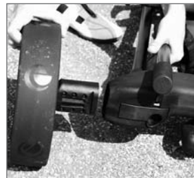
Abb. 14: Räder aufgesteckt?

Senden Sie uns immer Ihre Garantiekarte zu!