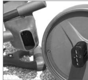
Abb. 12: Kontakte