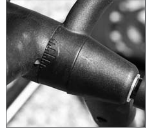
Abb. 5: Skalierung am Gelenk

Ist dies nicht so, dann korrigieren Sie bitte erneut die Position von Griff und Deichsel, bis die Gewichtsverteilung stimmig ist.