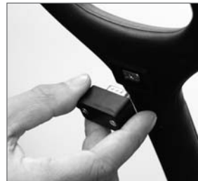
Abb. 8: Einsetzen des Schlüssels

Für einen neuen Schlüssel benötigen wir Garantiekarte, Kaufbeleg und Kopie Ihres Ausweises. Nur Sie persönlich erhalten einen neuen Elektronik-Schlüssel!