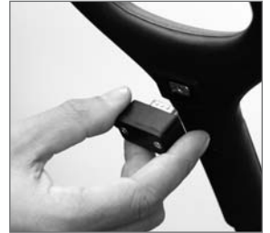
Elektronik-Schlüssel mit Griff

Senden Sie uns bitte die Garantiekarte zu!