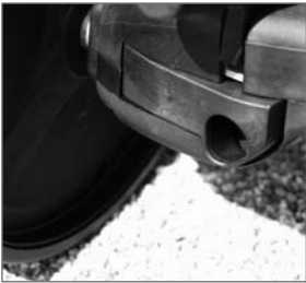
Abb. 10: Auslösehebel