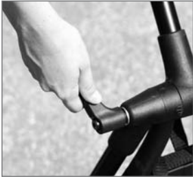
Abb. 4: Spannhebel betätigen