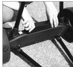
Abb. 3: Akku einsetzen