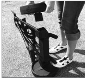
Abb. 11: Lösen des Rades

Der e-motion ist der kompakteste Elektrowagen auf dem Markt.