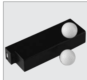
Abb. 15: Akku