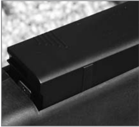
Abb. 1: Akku