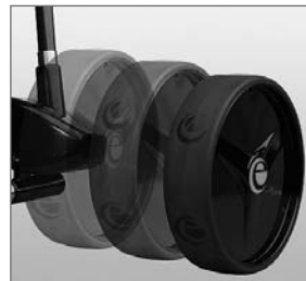
Abb. 2: Räder einsetzen

Den Akku erst nach Montage der Räder einsetzen und vor dem Abnehmen der Räder Akku wieder entfernen.