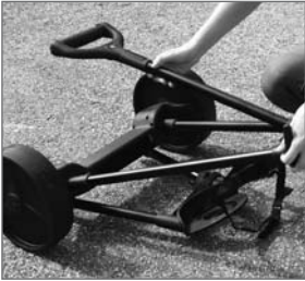
Abb. 9: Griff auf den Caddy