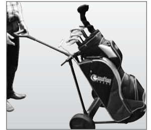
Abb. 6: Ausbalancieren